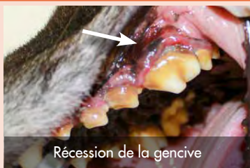
Récession de la gencive

Le tartre dentaire est, contrairement à ce que l'on pourrait penser, bien plus qu'un problème purement esthétique. Comment se forme-t-il, que doit-on savoir sur ses conséquences et comment y remédier ?