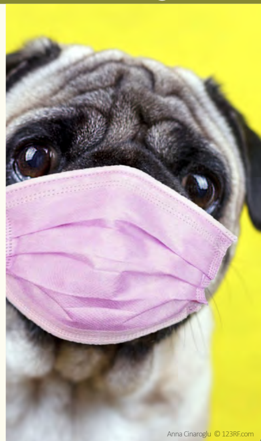
Anna Cinaroglu © 123RF.com

Heureusement, elle n'est pas contagieuse pour l'homme ! Si vous avez des questions concernant cette maladie ou la vaccination, n'hésitez pas à nous solliciter.